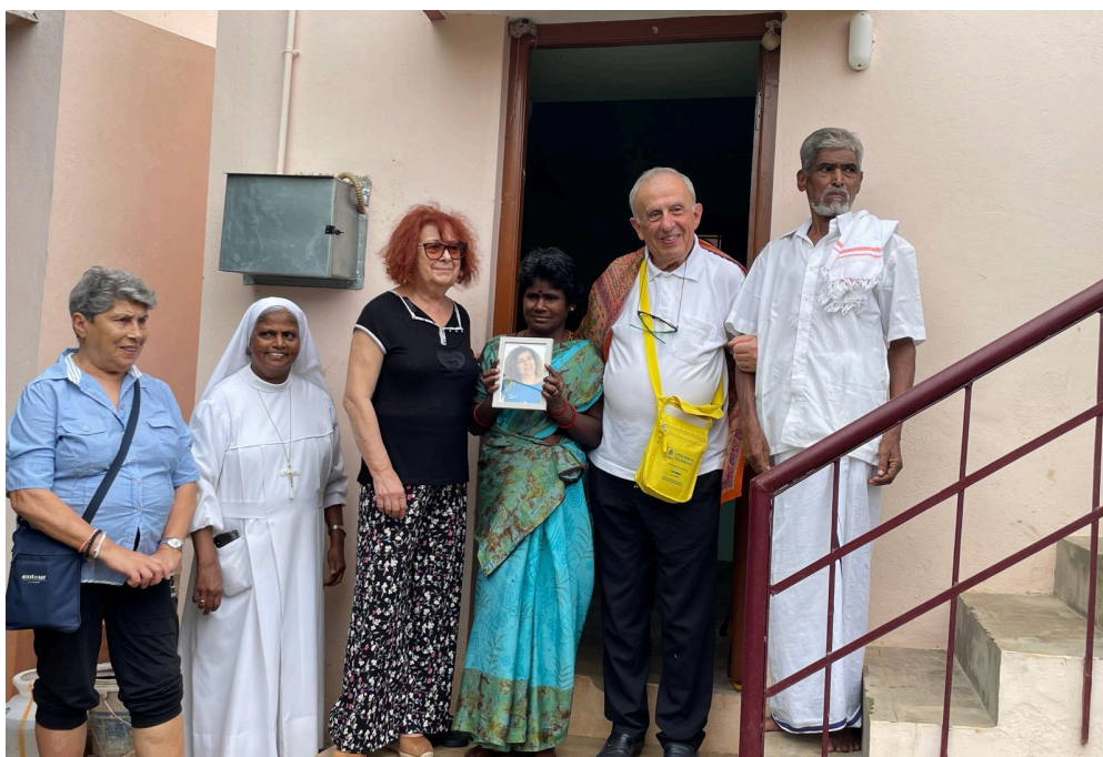
Casetta per famiglia bisognosa - Madurai